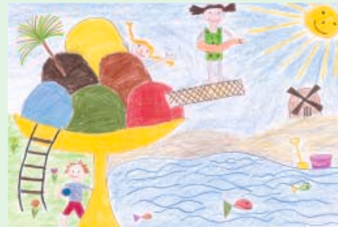
„Ferien“, Bild: Iris Unterweger

Bauchschmerzen und Blähungen sind Folgen der Störung der Bauchspeicheldrüse, die auch durch die regelmäßige Einnahme von Medikamenten nicht vollständig ausgeglichen werden kann. Es kann sein, daß der Muko-Betroffene daher auch während des Unterrichts öfter die Toilette aufsuchen muß.